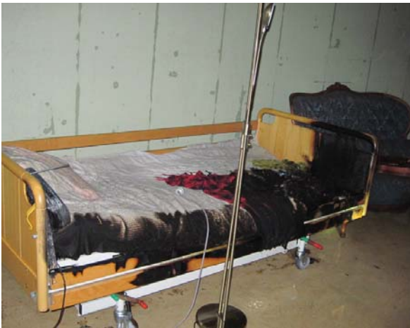
Bild 1 Brandskadad säng & halogenlampan

Den tidiga aktiveringen av det närmaste sprinklerhuvudet bekräftar dessutom att boendesprinklertekniken är livräddande!