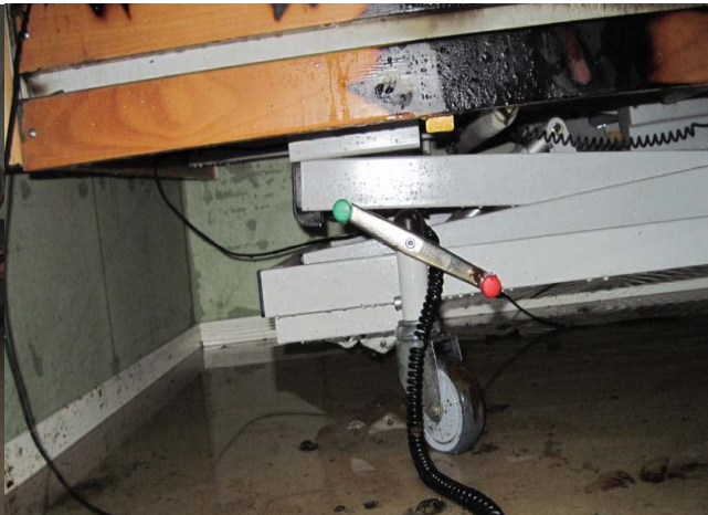
Bild 2 Vattenspegel efter släckning